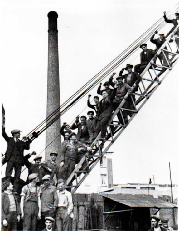
4 Des ouvriers en grève en juin 1936 Pourquoi les ouvriers font-ils grève ?